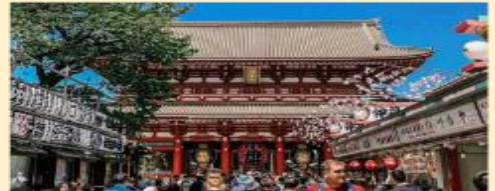
วัดอาซากุสะ SENSOJI TEMPEL | ASAKUSA TOKYO