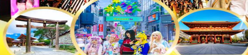
ศาลเจ้าเมจิ ช้อปปิ้ง ฮาราจุกุ วัดอาซากุสะ