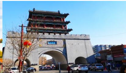
ถนนสายแมนจู