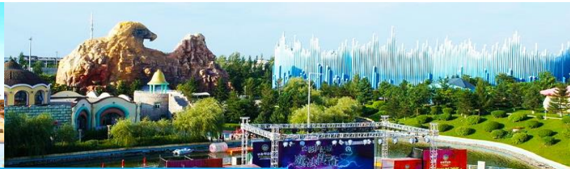
สวนสนุกธีมภาพยนตร์ ฉางชุน