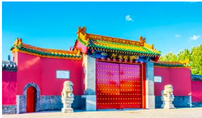
พระราชวังแมนจู