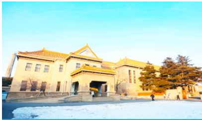
พระราชวังปวยี