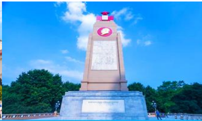
อนุสาวรีย์ฟ้งหง