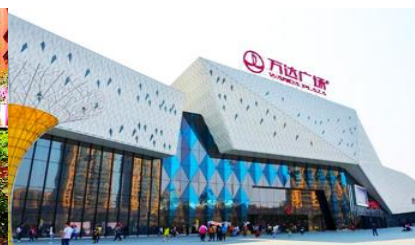
ห้างว่ันต้าสแควร์