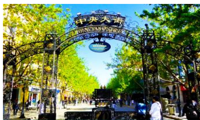
ถนนจงยงคู่