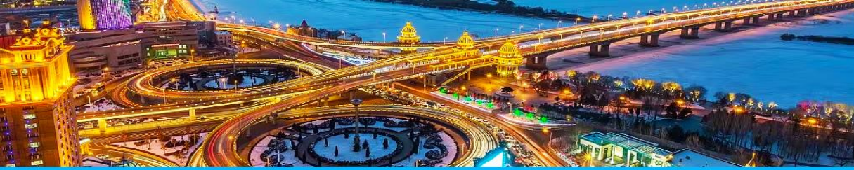
นครฮาร์บิน