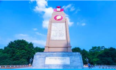
อนุสาวรีย์ฝงหง