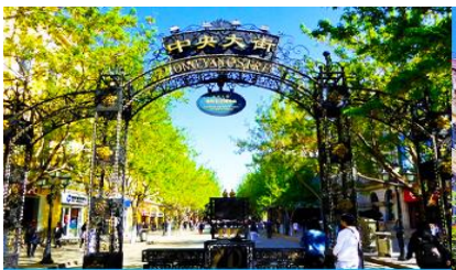
ถนนจงยงคู่