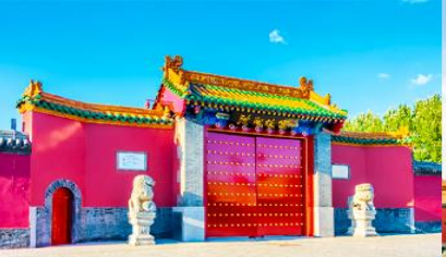
พระราชวังแมนจู