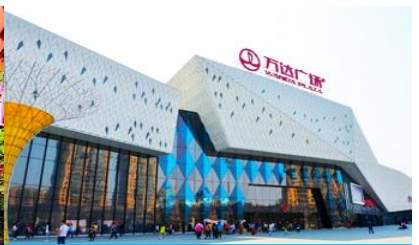
ห้างวานต้าแควร์