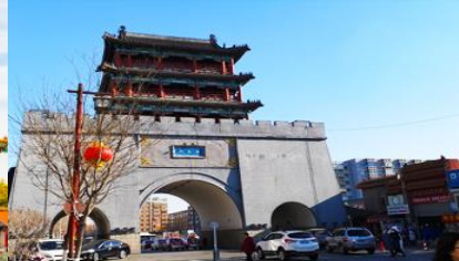
ถนนสายแมนจู