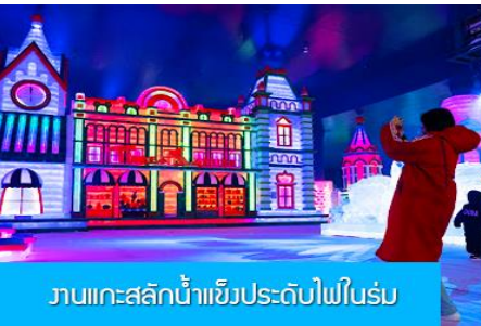
งานแกะสลักน้ำแข็งประดับไฟในร่ม