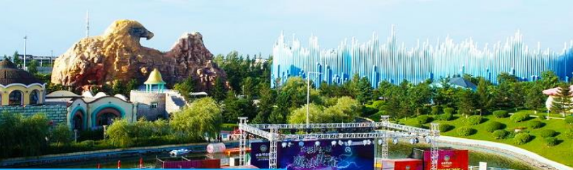
สวนสนุกธีมภาพยนตร์ ฉางชุน