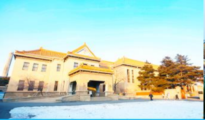
พระราชวังปวยี