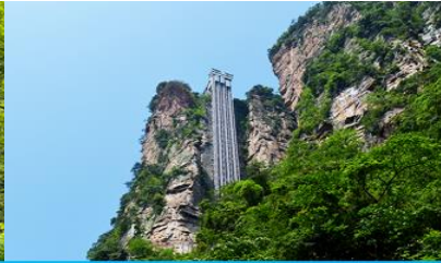
ลิฟท์แก้วไปหลม