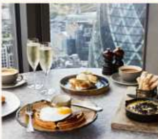
DUCK AND WAFFLE