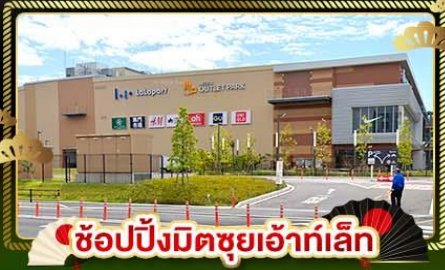
ช้อปปิ้งมิตรช้อปปิ้งเล็ก