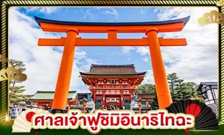
ศาลเจ้าฟูชิมิอินาริโทะ