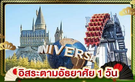
อิสระตามอัธยาศัย 1 วัน