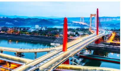
เมืองหยีชาง

วันที่ห้า เมืองจางเจียเจีย-เลือกซื้อโปรแกรมทัวร์เสริม OPTIONAL TOUR - ร้านหยก-ร้านใบชา-เมืองหยีชาง