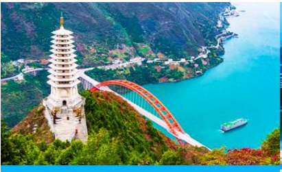
เมืองหยี่ชาง

-โปร่งใสน่าเชื่อถือ ไม่มีค่าใช้จ่ายซ่อนเร้น ขายออฟชั่น 1. จุดชมวิวยูนิเวิลด์เขาอุทยานอวตาร, และ ชมชมลัพท์แก้วไปหลง 2. โชว์จิ้งจอกขาว โปรอ่านรายละเอียดในโปรแกรม