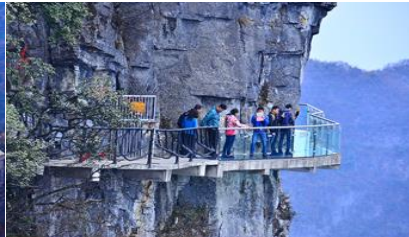
หน้าพลาวย้ำกาวเดินกระจก