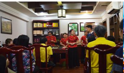
ร้านใบชา