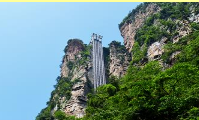
ลิฟท์แก้วไปหลง