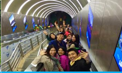
บันไดเลื่อนทะลุภูเขา