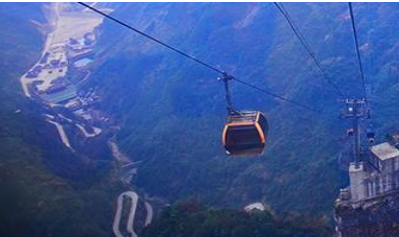
กระเช้าขึ้นเขาเทียนเหมินซาน