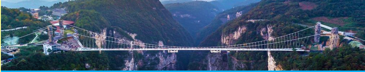
สะพานกระจกข้ามหุบเขาแกรนด์แคนยอน

โปรแกรมเสริมที่ 3 โปรแกรมเที่ยวชมสะพานกระจกพร้อมหุบเขาแกรนด์แคนยอนจากเจียเจีย (ผู้เข้าร่วมขั้นต่ำ 15 ท่าน) ใช้เวลาประมาณ 2-3 ชั่วโมง (ขึ้นอยู่กับจำนวนนักท่องเที่ยวในแต่ละวัน) อัตราค่าบริการท่านละ 400 หยวนหรือ 2,000 บาท นำท่านเที่ยวชมสะพานกระจกที่สร้างข้ามหุบเขาที่ยาวที่สุดในโลก ท้าทายความกล้าของท่านด้วยการเดินบนพื้นกระจกใสที่สามารถมองเห็นก้นเหวลึกที่อยู่เบื้องล่าง....อัตราค่าบริการรวม ค่าบัตรเข้าอุทยาน ค่ารถรับส่งภายในเขตอุทยาน ค่าน้ำดื่มของไกด์ท้องถิ่น