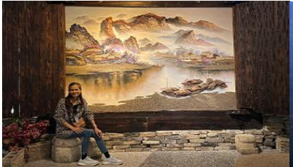
พิพิธภัณฑ์ภาพเขียนหินทราย

พักที่ ZHENMIAN HOTEL OR YINXIANG HOTEL ระดับ 4 ดาวท้องถิ่นหรือเทียบเท่าในเมืองจางเจียเจี๋ย