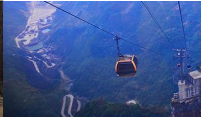
กระเช้าขึ้นเขาเทียนเหมินซาน