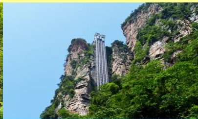
ลิฟท์แก้วไปหลง