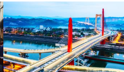
เมืองหยีชาง