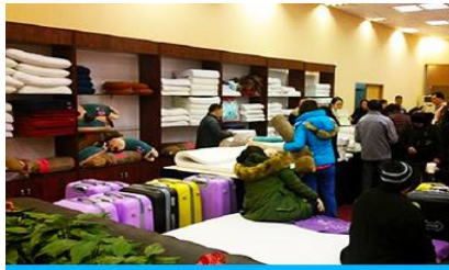
ศูนย์จำหน่ายผลิตภัณฑ์ยางพารา