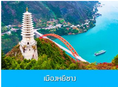
เมืองหยีซาง