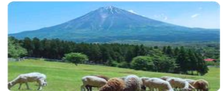
ภาพใช้เพื่อประกอบการโฆษณา