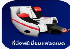
ที่นั่งพรีเมียมแพลตฟอร์ม