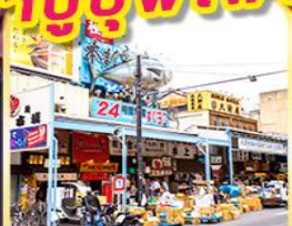
ตลาดปลาชิกิจิ