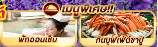
พักผ่อนเซ็น