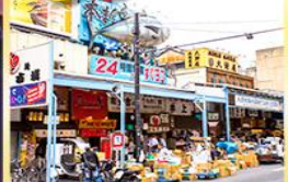
ตลาดปลาซึกิจิ