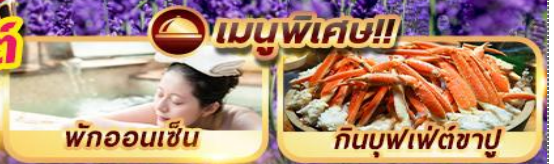
พักผ่อนเซ็น