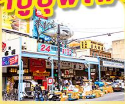
ตลาดปลาชิกิจิ