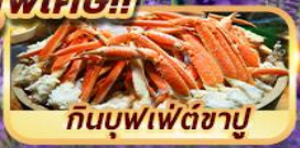
กินบุฟเฟ่ต์ชาบู