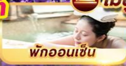
พักผ่อนเซ็น