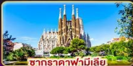
ซากradaฟามีเลีย

สัมผัสเสน่ห์ลาเวนเดอร์ "โปรวองซ์" แห่งฝรั่งเศสใต้