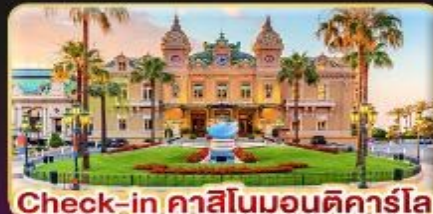
Check-in คาสีโนมอนติคาร์โล