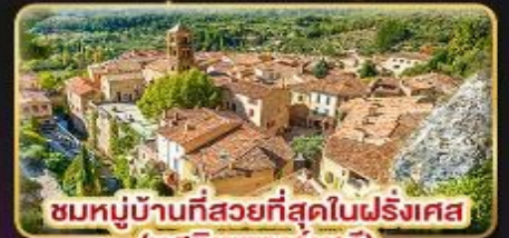
ชมหมู่บ้านที่สวยงามที่สุดในฝรั่งเศส (มูสตีเยแซงกมารี)