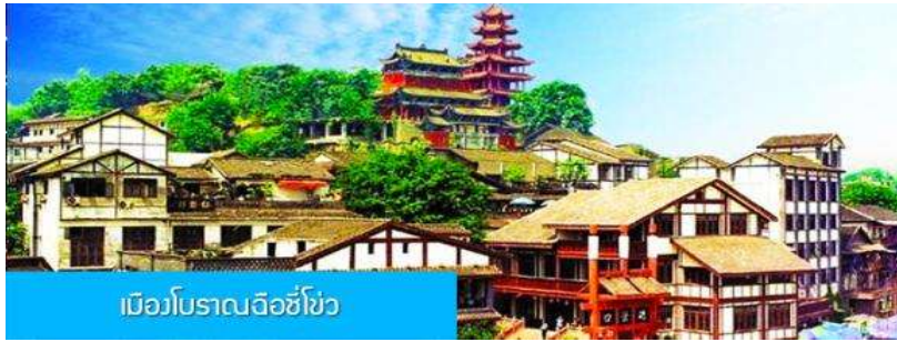
เมืองโบราณฉือชิว