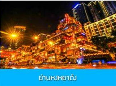
ย่านหงหยาดัง