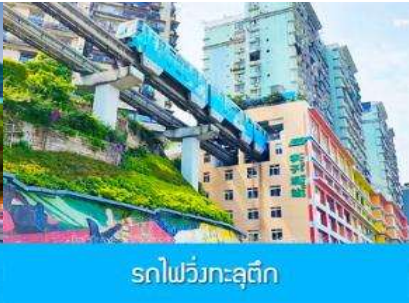
รถไฟวิงทะเลติ๊ก