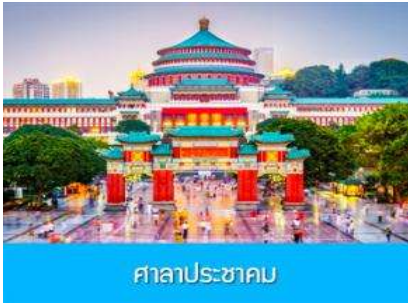
ศาลาประชาคม

ค่ำ รับประทานอาหารค่ำ ณ ภัตตาคาร พักที่ DAWEI YING HOTEL โรงแรมระดับ 4 ดาวหรือเทียบเท่าในเมืองอู่หลง