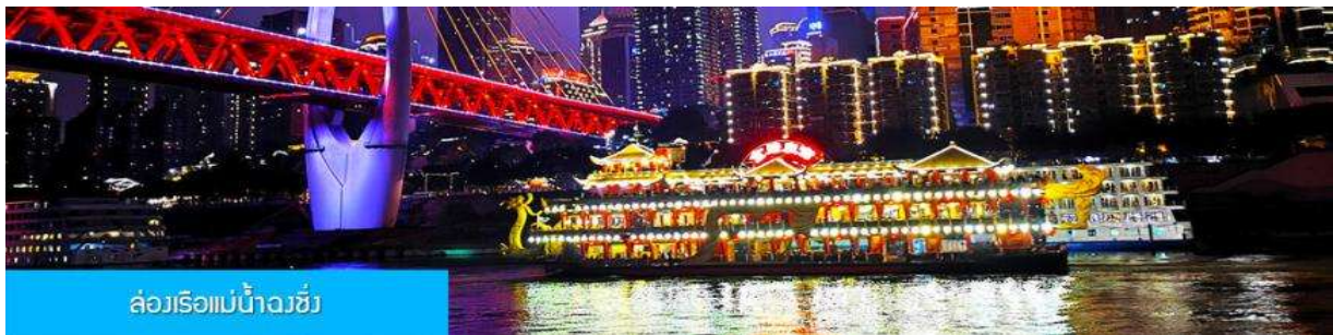
ล่องเรือแม่น้ำฉางชวี