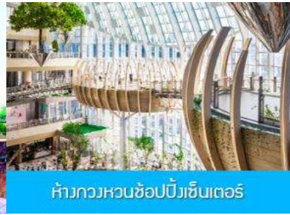
ห้างกวงหวนช้อปปิ้งเซ็นเตอร์