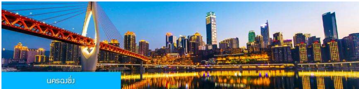
นครฉงชิ่ง