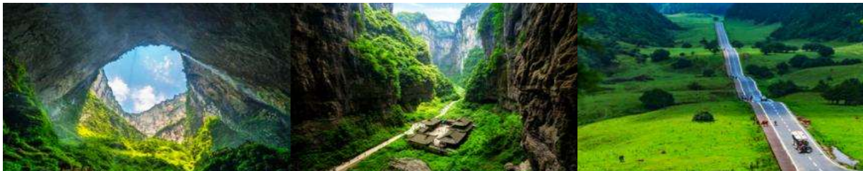
อุทยานหลุมฟ้า