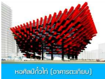
หอศิลป์แก้วโก่ง (อาคารตะเกียบ)