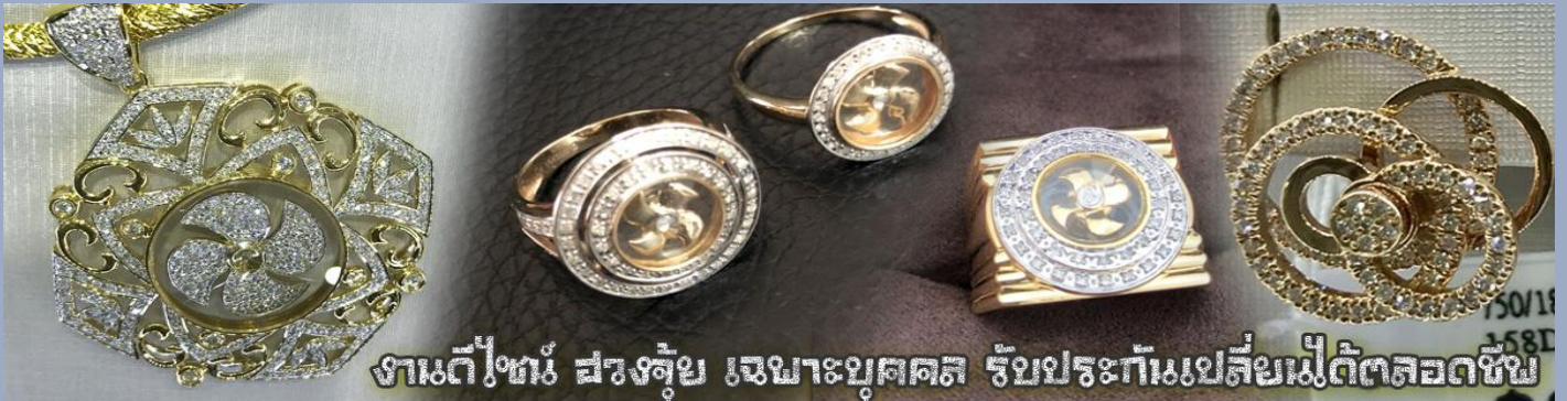
งานตีเพชร สรงจุ่ม เฆาะบุคคล รับประกันเปลี่ยนเฟ้ต์ตลอดชีพ

เที่ยง รับประทานอาหารกลางวัน ณ กัดตาดาร ***เมนูท่านอย่างฮ่องกงแสนอร่อย***