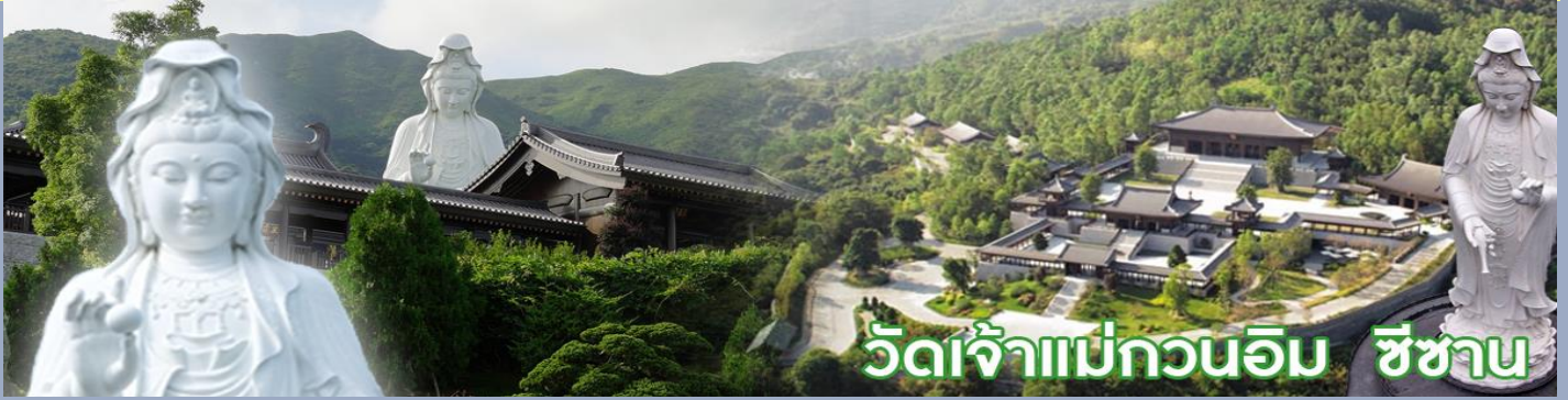
วัดเจ้าแม่กวนอิม ชีซาน

วัดชีซาน หลายคนที่เคยไปเที่ยวฮ่องกงมาแล้ว อาจจะยังไม่เคยเยือนวัดชีซาน หรือ Tsz Shan Monastery เป็นวัดที่มีเจ้าแม่กวนอิมองค์ใหญ่เป็นอันดับสองของโลก มีความสูงถึง 76 เมตร ตั้งอยู่บนเนื้อที่กว่า 29 ไร่ ในเกาะฮ่องกง โดยมีนาย ลีกาซิง มหาเศรษฐีชื่อดังของฮ่องกง บริจาคเงินสร้างวัดถึง 193 ล้านดอลลาร์เลยทีเดียว