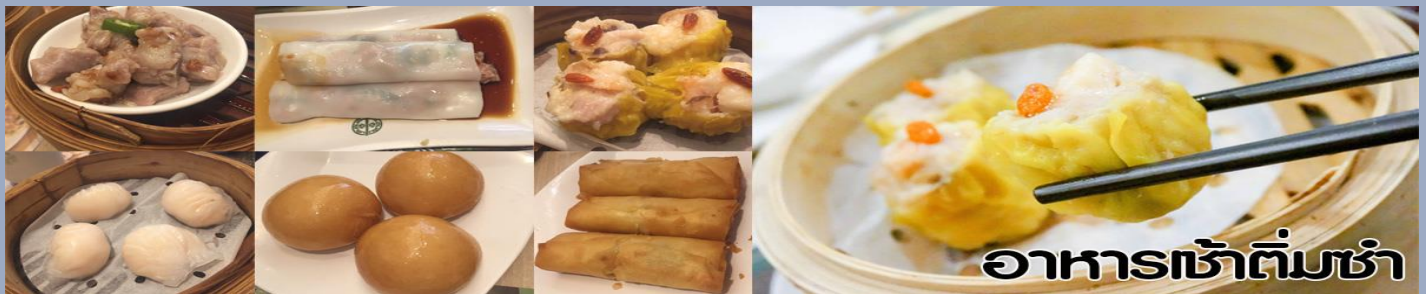
อาหารเช้าติ่มซำ

นำท่านไปไหว้ เจ้าแม่กวนอิมสงอำ (Kun Im Temple Hung Hom) เป็นวัดเจ้าแม่กวนอิมที่มีชื่อเสียงแห่งหนึ่งในฮ่องกง ขอพรเจ้าแม่กวนอิมพระโพธิสัตว์แห่งความเมตตา ช่วยคุ้มครองและปกป้องรักษาไว้ที่เจ้าแม่กวนอิมที่ Hung Hom หรือ "Hung Hom Kwun Yum Temple" เป็นวัดเก่าแก่ของฮ่องกงสร้างตั้งแต่ปี ค.ศ. 1873 ถึงแม้จะเป็นวัดขนาดเล็กที่ไม่ได้สวยงามมากมาย แต่เป็นวัดเจ้าแม่กวนอิมที่ชาวฮ่องกงนับถือมาก แทบทุกวันจะมีคนมาบูชาขอพรกันแน่นวัด ถ้าใครที่ชอบเสียงเชิมซีเซาบอกว่าที่นี่แมน่มากที่พิเศษกว่านั้น นอกจากสักการะขอพรแล้วยังมีพิธีขอขงอั้งเปาจากเจ้าแม่กวนอิมอีกด้วย ซึ่งคนส่วนใหญ่จะนิยมไปเทศกาลตรุษจีนเพราะเป็นศิริมงคลในเทศกาลปีใหม่ ซึ่งทางวัดจะจำหน่ายอุปกรณ์สำหรับเช่นไหว้พร้อมของแดงไว้ให้ผู้มา