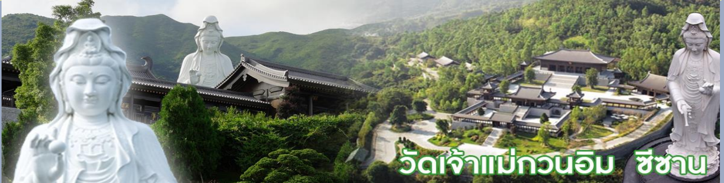
วัดเจ้าแม่กวนอิม ชีซาน

วัดชีซาน หลายคนที่เคยไปเที่ยวฮ่องกงมาแล้ว อาจจะยังไม่เคยเยือนวัดชีซาน หรือ Tsz Shan Monastery เป็นวัดที่มีเจ้าแม่กวนอิมองค์ใหญ่เป็นอันดับสองของโลก มีความสูงถึง 76 เมตร ตั้งอยู่บนเนื้อที่กว่า 29 ไร่ ในเกาะฮ่องกง โดยมีนาย ลีกาซิง มหาเศรษฐีชื่อดังของฮ่องกง บริจาคเงินสร้างวัดถึง 193 ล้านดอลลาร์เลยทีเดียว