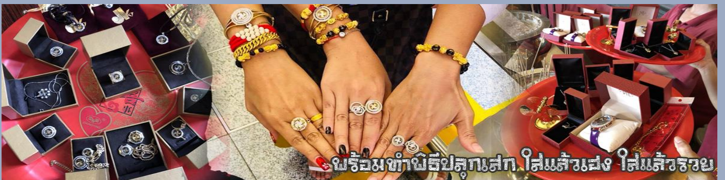
พร้อมทำพิธีปลุกเสก ใส่เส้นแดง ใส่เส้นขาว

นำท่านเยี่ยมชม โรงงานจิวเวลรี่ ที่ขึ้นชื่อของฮ่องกงพบกับงานดีไซน์ที่ได้รับรางวัลอันดับยอดเยี่ยม และใช้ในการเสริมดวงเรื่อง ฮวงจุ้ยนำความโชดดี มั่งมั่งแก่ผู้สวมใส่ ซึ่งในเมืองไทยก็ได้นิยมแพร่หลายออกไป ไม่กว่าจะเป็นกลุ่ม ดารา นักการเมือง พ่อค้าแม่ขายที่ประกอบธุรกิจ เจ้าของกิจการห้างร้านต่าง ๆ ซึ่งเชื่อกันว่าจะนำสิ่งดี ๆ ปัดเป่าสิ่งชั่วร้ายให้กับบุคคลที่สวมใส่ ซึ่งจะมีมากมายหลายชนิด เช่นจี้กั๊กัน แหวนรุ่นต่าง ๆ นาฬิกาข้อมือ (ซึ่งผู้สวมใส่จะได้รับการดูอายุมือจากซินเซปประจำร้าน เพื่อนำวิธีการเสริมดวงในการสวมใส่โดยไม่ติดค่าบริการ)