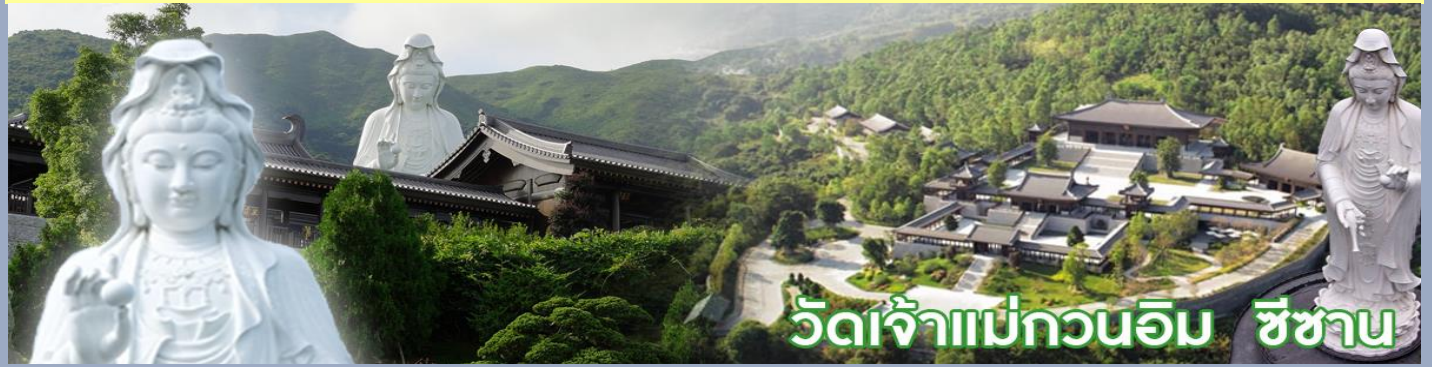
วัดเจ้าแม่กวนอิม ชีซาน

วัดชีซาน หลายคนที่เคยไปเที่ยวฮ่องกงมาแล้ว อาจจะยังไม่เคยเยือนวัดชีซาน หรือ Tsz Shan Monastery เป็นวัดที่มีเจ้าแม่กวนอิมองค์ใหญ่เป็นอันดับสองของโลก มีความสูงถึง 76 เมตร ตั้งอยู่บนเนื้อที่กว่า 29 ไร่ ในเกาะฮ่องกง โดยมีนาย ลีกาซิง มหาเศรษฐีชื่อดังของฮ่องกง บริจาคเงินสร้างวัดถึง 193 ล้านดอลลาร์เลยทีเดียว