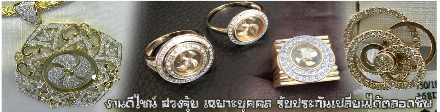
งานตีไท้ ฝังจู้ย เจมาะบุคคต รัยประกำเมบ่ส่ยเม่ได้ตลอดซึบ

นำท่านเยี่ยมชม โรงงานจิวเวลรี่ ที่ขึ้นชื่อของฮ่องกงพบกับงานดีไซน์ที่ได้รับรางวัลอันดับยอดเยี่ยม และใช้ในการเสริมดวงเรื่อง ฮวงจุ้ยนำความโชคดี มั่งมั่งแก่ผู้สวมใส่ ซึ่งในเมืองไทยก็ได้นิยมแพร่หลายออกไป ไม่กว่าจะเป็นกลุ่ม ดารา นักการเมือง พ่อค้าแม่ขายที่ประกอบธุรกิจ เจ้าของกิจการห้างร้านต่างๆ ซึ่งเชื่อกันว่าจะนำสิ่งดี ๆ ปัดเป่าสิ่งชั่วร้ายให้กับบุคคลที่สวมใส่ ซึ่งจะมีมากมายหลายชนิด เช่นจี้กิ้งหิ้น แหวนรุ่งต่างๆ นาฬิกาข้อมือ (ซึ่งผู้สวมใส่จะได้รับการดูลายมือจากซินเซประจําร้าน เพื่อนำวิธีการเสริมดวงในการสวมใส่โดยไม่ได้ติดค่าบริการ)