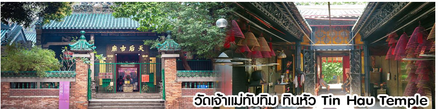
วัดเจ้าแม่ทับทิม ทินหัว Tin Hau Temple

นำทุกท่าน ไหว้ศาลเจ้าแม่ทับทิม ทินหัว (Tin Hau Temple) เป็นวัดเก่าแก่และสำคัญอีกวัดหนึ่งของฮ่องกง เพราะในสมัยก่อนฮ่องกงเป็นเพียงหมู่บ้านชาวประมง ซึ่งเคารพนับถือเจ้าแม่ทับทิมว่าเป็นเทพีแห่งทะเล เพื่อให้เดินทางปลอดภัย เวลาออกไปทำงานไกล ๆ หรือออกหาปลา นอกจากการมาสักการะบูชาเจ้าแม่ทับทิมในเรื่องของการเดินทางให้ปลอดภัยแล้ว ไฮไลท์สำคัญอีกอย่างหนึ่งของ วัดเจ้าแม่ทับทิม ทินหัว (Tin Hau Temple) จะเป็นขดรูปปั้นแดงขนาดใหญ่ ที่แขวนอยู่ตามเพดานด้านในวิหารของวัดเต็มไปหมด จะยิ่งสวยงามในยามที่มีแสงแดงส่องลงมาเหมือนเป็นลำแสงส่องทะลุวันรูปแปลกตายิ่งนัก ส่วนอาคารของวัดก็จะเป็นสถาปัตยกรรมแบบวัดจีน สร้างขึ้นตั้งแต่ปีค.ศ. 1876 โดยทางเข้าของวัดจะอยู่ติดกับสวนสาธารณะเล็กๆ ที่มีต้นไม้ใหญ่หลายต้น ให้บรรยากาศร่มรื่น