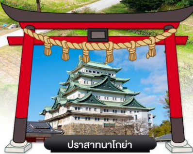
ปราสาทนาโกย่า