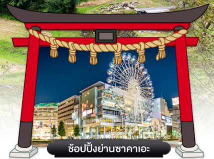
ช้อปปิ้งย่านซาคาเอะ