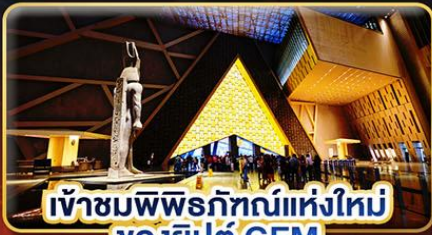
เข้าชมพิพิธภัณฑ์แห่งใหม่ ของอียิปต์ GEM

📅 เดินทาง 21-29 ต.ค. | 02-10 ธ.ค. 68 | 30 - 07 ม.ค. 69