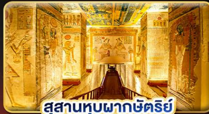
สุสานหุบผากษัตริย์