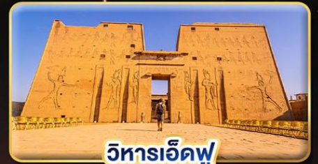
วิหารเอ็ดฟู

น้ำหนักกระเป๋า 23Kg. (บินระหว่างประเทศ และบินภายใน)