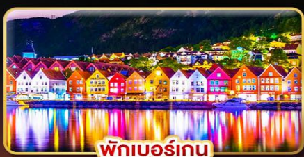
พิกเบอร์เกน