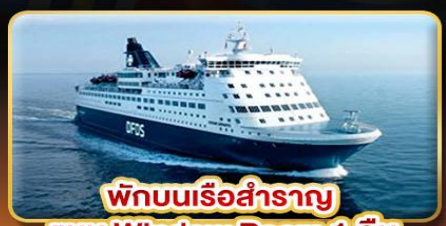
พิกบนเรือสำราญ แบบ Window Room 1 คืน