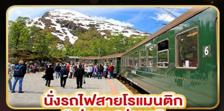
นั่งรถไฟสายโรแมนติก "พร้อมสปา"