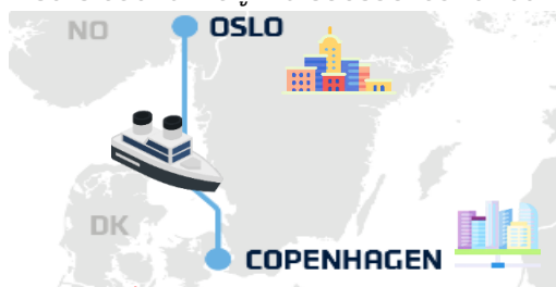
พิเศษ มื้อค่ำ DFDS Buffet Scandinavia