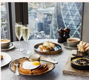
DUCK AND WAFFLE