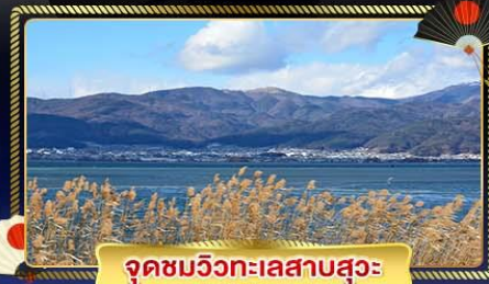
จุดชมวิวกะเลสาบสุวะ