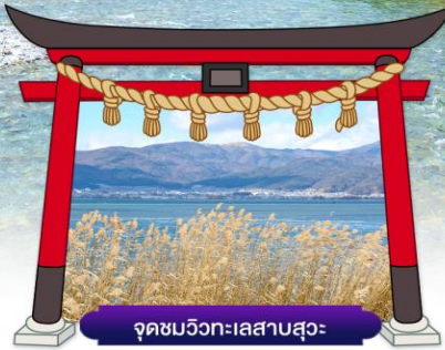
จุดชมวิวกะเลสาบสุวะ