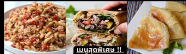
เมนูสุดพิเศษ !! KOSHARI (ข้าวคลุกถั่ว) / SHAWERMA (เนื้อห่อแป้ง) / FITEER BALADI (พิซซ่าอียิปต์)