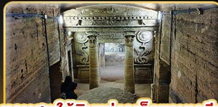
หลุมศพใต้ดินแห่งอเล็กซานเดรีย