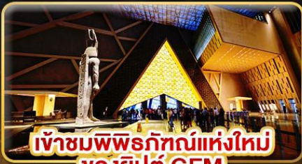
เข้าชมพิพิธภัณฑ์แห่งใหม่ ของอียิปต์ GEM

ชม 1 ใน 7 สิ่งมหัศจรรย์ของโลก “มหาพีระมิดแห่งกิซ่า”