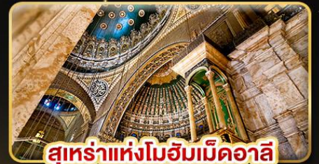
สุเหร่าแห่งโมฮัมเหม็ดอาลี

🧳 น้ำหนักกระเป๋า 23Kg. (บินระหว่างประเทศ และบินภายใน)