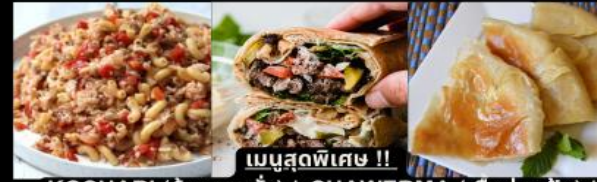
เมนูสุดพิเศษ !! KOSHARI (ข้าวคลุกถั่ว) / SHAWERMA (เนื้อห่อแป้ง) / FITEER BALADI (พิซซ่าอียิปต์)