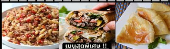
เมนูสุดพิเศษ !! KOSHARI (ข้าวคลุกถั่ว) / SHAWERMA (เนื้อห่อแป้ง) / FITEER BALADI (พืชชาอียิปต์)