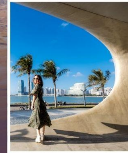
ห้องสมุดหยุนตง