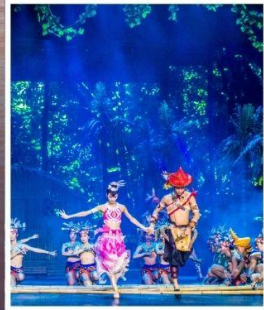
SANYA ROMANCE PARK