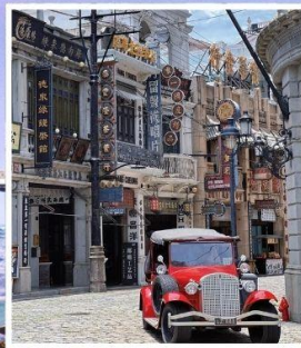
โรงถ่ายภาพยนตร์ เฟิงเสี่ยวกั๊ง