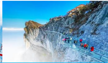
ระเบียงทางเดินกระจกเลียบนหน้าผา

วันที่ห้า เมืองโบราณฟงหวง–เมืองจางเจียเจี๋ย-ศูนย์ผลิตภัณฑ์ยางพารา– กระเช้าขึ้นเขาเจ็ดดาว – ระเบียงแก้วเลียบนหน้าผา – SKY EYE – (เลือกซื้อโปรแกรมเสริม OPTIONAL TOUR ไร่จิ้งจอกขาว)