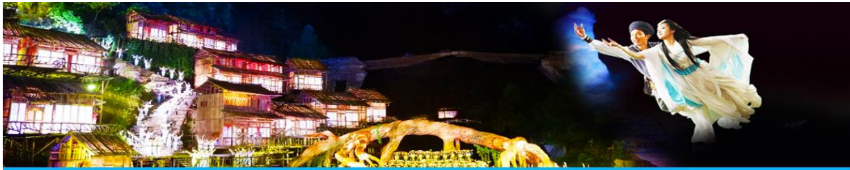
The Love Story of a Wooden Man and Fairy fox

หรือท่านสามารถเลือกซื้อโปรแกรมเสริม เป็นบัตรชมการแสดง ชุด The Love Story of a Wooden man and Fairy fox หรือที่เรียกกันในหมู่นักท่องเที่ยวไทยว่า โชว์จิ้งจอกขาว เป็นการแสดงกลางแจ้งที่ทุ่มทุนสร้างอย่างสุดอลังการ เป็นการแสดงที่น่าดูชมที่สุดในเมืองจางเจียเจียะ การแสดงชุดนี้ใช้ภูเขาประตูดาวสวรรค์เป็นฉากหลังประกอบการแสดง ซึ่งให้ความรู้สึกสมจริงเสมือนผู้ชมและนักแสดงอยู่ท่ามกลางธรรมชาติ ใช้ทีมงานนักแสดงหลายร้อยคน และระบบแสง สี เสียงที่ทันสมัยประกอบการแสดง