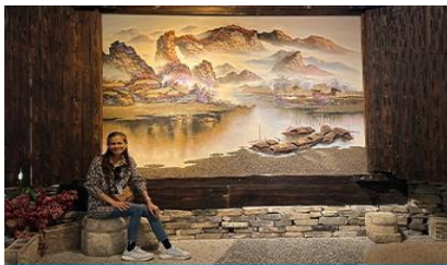
พิพิธภัณฑ์ภาพเขียนหินทราย

พักที่ YICHANG MELJI BOYUE HOTEL โรงแรมระดับ 4 ดาวหรือเทียบเท่าในเมืองจางเจียเจี๋ย