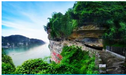
สวนถ้ำสามสหาย