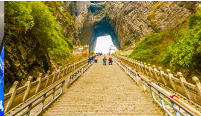
บันได 999 ขั้น

นำท่านสู่ โพรงประตูดาวร์ค 天门洞 โดย บันไดเลื่อนที่สร้างขึ้นโดยการเจาะทะลุภูเขา 穿山手扶梯 มีความสูงถึง 7 ชั้น เป็นสิ่งอำนวยความสะดวกใหม่ล่าสุดของ เขาเทียนเหมิน ซึ่งหาดูได้ยากตามแหล่งท่องเที่ยวต่างๆ ทั่วโลก บริเวณนี้ ท่านจะได้ถ่ายภาพ ประตูดาวร์ค อย่างใกล้ชิด โดยในปี 1990 มีนักบินผาดโผนชาวรัสเซียขับเครื่องบิน 3 ลำบินลอดผ่านช่องโพรงหินประตูดาวร์คแห่งนี้พร้อมกัน ภาพประวัติศาสตร์นี้ถูกบันทึกและเผยแพร่ไปทั่วโลก ภูเขาเทียนเหมินซานจึงเป็นที่รู้จักของนักผจญภัยทั่วโลกที่อยากเดินทางมาสัมผัสด้วยตัวเอง..... จากนั้นท่านสามารถทดสอบกำลังขาของท่านโดยการเดินลงบันได 999 ขั้น เพื่อลงมายังลานกว้างที่เป็นจุดถ่ายรูปด้านล่างของประตูดาวร์ค ท่านที่ไม่ต้องการเดินบันไดลง สามารถใช้บันไดเลื่อนแทนการเดินลงบันได 999 ขั้น ณ ลานกว้างด้านล่างเป็นจุดถ่ายรูปที่ดีที่สุดที่สามารถมองเห็นเขาประตูดาวร์คได้อย่างชัดเจน จากนั้นนำท่านนั่งกระเช้าลงจากเขาเทียนเหมินซาน