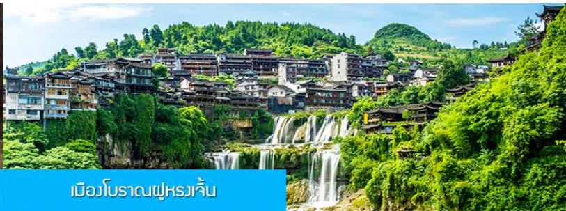
เมืองโบราณฝูหรงเจิ้น