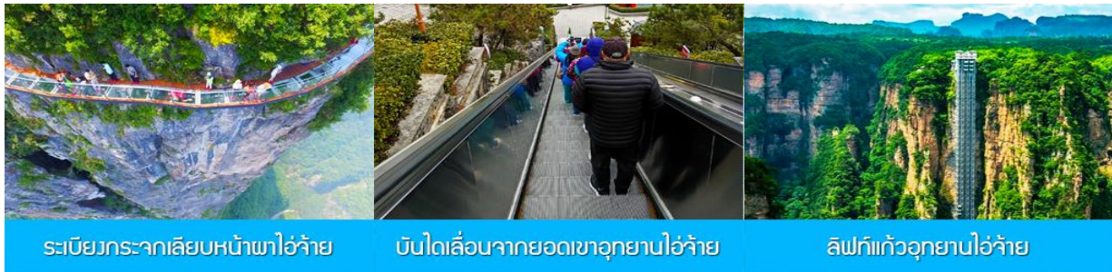
ระเบียงกระจกเลียนหน้าผาอู๋จ้าย