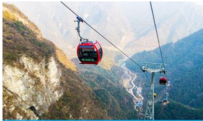
กระเช้าขึ้น/ลงเขาเจ็ดดาว