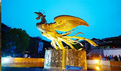
จัตุรัสหงส์