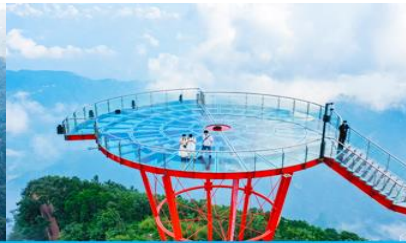
ระเบียงชมวิว Sky Eye