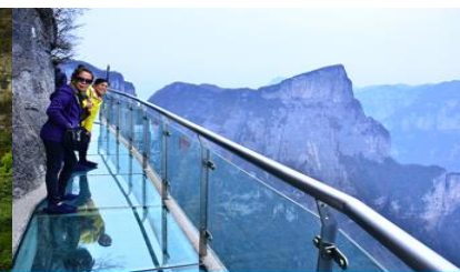
หน้าพลาวยฟ้าทางเดินกระจก

วันที่หก เมืองจางเจียเจีย – เลือกซื้อโปรแกรมเสริม OPTIONAL TOUR แพ็คเก็จเที่ยวภูเขาเทียนเหมินชาน – ร้านหยก- ร้านไบชา – เดินทางกลับเมืองหยีซัง