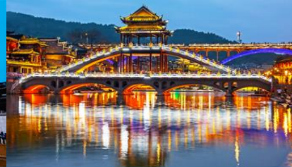
สะพานหงเจียว