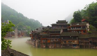
เมืองโบราณฟิ่งหวง