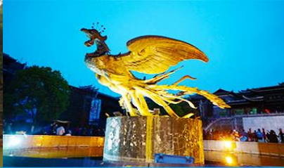
จัตุรัสหงส์