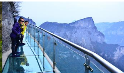
หน้าพลาวยิป้าทางเดินกระจก

วันที่หก เมืองจางเจียเจีย – เลือกซื้อโปรแกรมเสริม OPTIONAL TOUR แพคเกจเที่ยวภูเขาเทียนเหมินซาน – ร้านหยก- ร้านใบชา – เดินทางกลับเมืองหยีซัง