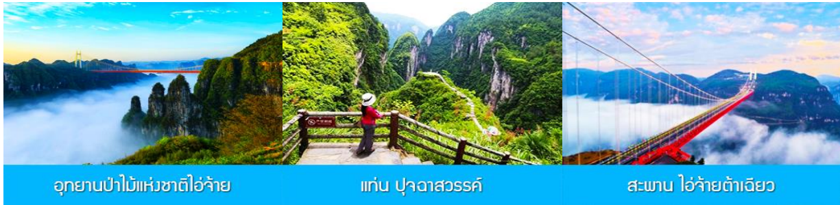
อุทยานป่าไม้แห่งชาติไ้อ๋จ้าย

พักที่ โรงแรม CHAXITAI HOLIDAY HOTEL ระดับ 5 ดาวห้องถื่นหรือเทียบเท่าในย่านผู้ทรงเงิน