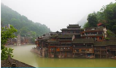
เมืองโบราณฟิ่งหวง