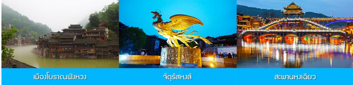
เมืองโบราณฟิงหวง