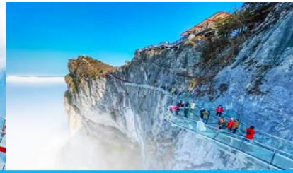
ระเบียงทางเดินกระจกเลียบบหน้าผา

วันที่ห้า เมืองโบราณฟงหวง-เมืองจางเจียเจี๋ย-ศูนย์ผลิตภัณฑ์ayangพารา- กระเช้าขึ้นเขาเจ็ดดาว - ระเบียงแก้วเลียบบหน้าผา - SKY EYE - (เลือกซื้อโปรแกรมเสริม OPTIONAL TOUR ไร่จิ้งจอกขาว)