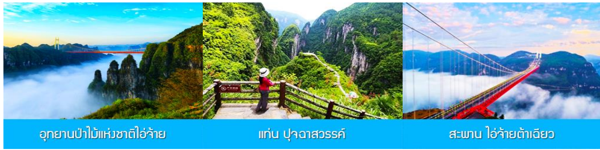
อุทยานป่าไม้แห่งชาติไ้อ้วาย แก่น ปูจาสวรรค์ สะพาน ไ้อ้วายต้าเฉียว

พักที่ โรงแรม CHAXITAI HOLIDAY HOTEL ระดับ 5 ดาวห้องถื่นหรือเทียบเท่าในย่านฝูหรงเจิ้น