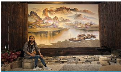
พิพิธภัณฑ์ภาพเขียนหินทราย

พักที่ YICHANG MELJI BOYUE HOTEL โรงแรมระดับ 4 ดาวหรือเทียบเท่าในเมืองจางเจียเจี๋ย