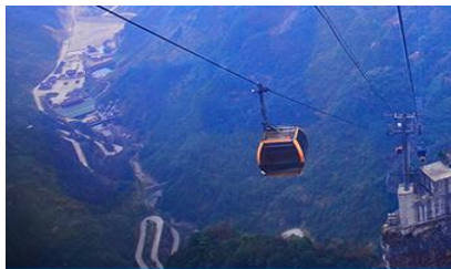
กระเช้าขึ้นเทียนเหมินซาน

อัตราค่าบริการสำหรับโปรแกรมเสริมการแสดงชุด The love Story of Wooden man and Fairy Fox ท่านละ 400 หยวน (หรือประมาณ 2000.-บาทขึ้นอยู่กับอัตราแลกเปลี่ยน) ระยะเวลาที่ใช้ในการเที่ยวชมการแสดง ประมาณ 3 ชั่วโมง รวมเวลาเดินทางไป กลับค่าบริการรวม ค่าบัตรเข้าชม ค่ารถรับ ส่ง และค่าน้ำดื่มของไกด์ท้องถิ่น