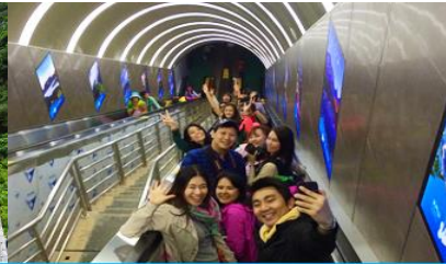
บันไดเลื่อนทะลุภูเขา