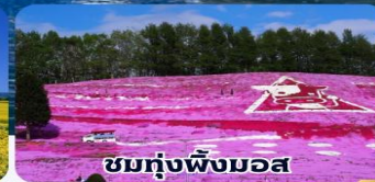
ชมทุ่งพืชมอส