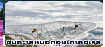
ชมทะเลหมอกออนโกเทอเรส