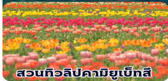
สวนทิวลิปคามิยูเบทสึ