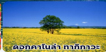
ดอกคาโนล่า ทากิกาวะ