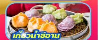
เกี๊ยวน้ำซีอาน