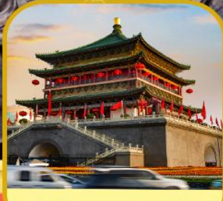
จัตุรัสหอกลอง หอระฆัง