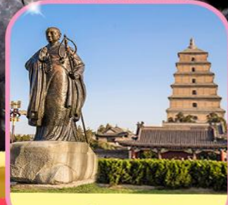
เจดีย์ห่านป่าใหญ่