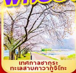
เทศกาลซากุระ ทะเลสาบคาวากูจิโกะ