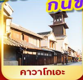
คาวาโกเอะ