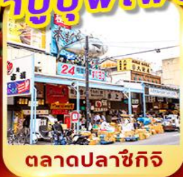
ตลาดปลาซึกิจิ