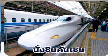
นั่งชินคันเซน