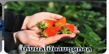
เก็บผลไม้ตามฤดูกาล