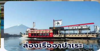
ล่องเรืออปาเระ