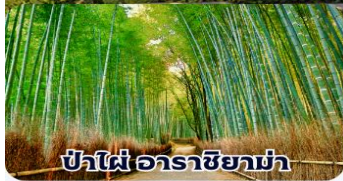
ป่าไผ่ อาราชิมายาม่า