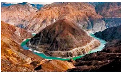
โค้งแรกของแม่น้ำจินซาเคียว

พักที่ PHOENIX HOTEL โรงแรมระดับ 4 ดาวท้องถิ่น หรือเทียบเท่าในเมืองเซี่ยงไฮ้