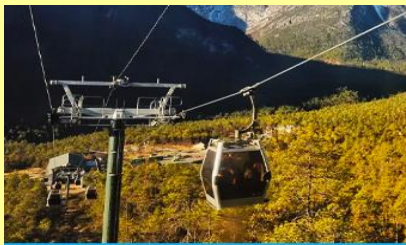
นั่งกระเช้าสถานี หยุนชานผิง