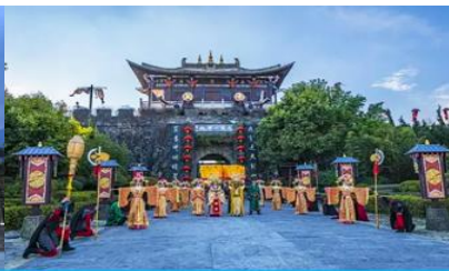
โรงถ่ายทำภาพยนตร์ แปดเทพอสูรมังกรฟ้า