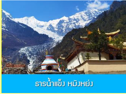
ธารน้ำแข็ง หมิวหย่ง