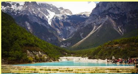
อุทยานไป๋ส่วยเหอ (หุบเขาพระจันทร์สีน้ำเงิน)