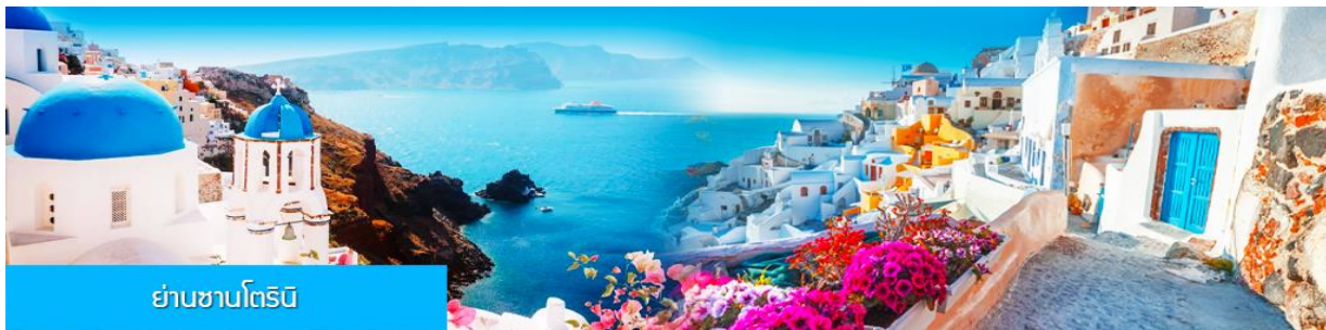
ย่านซานโตรินี่