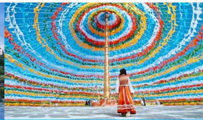
ซุ้มผ้ายันต์หลากหลาย