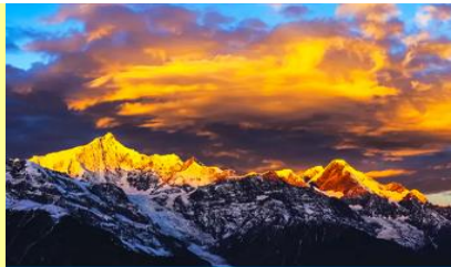
ภูเขาหิมะเหมยหลี่