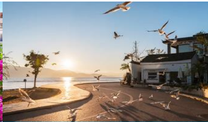
ย่านชายหาดรูป S