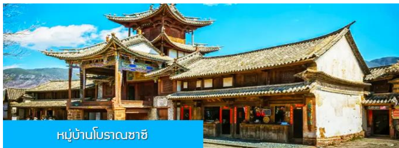
หมู่บ้านโบราณซาซี