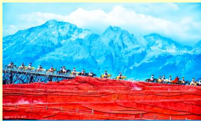
IMPRESSION OF LIJIANG