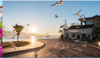
ย่านชายหาดรูป S