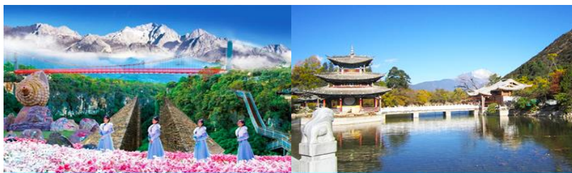
Snow Mountain Canyon Park

พักที่ LIJIANG FENGHUANG HOTEL โรงแรมระดับ 4 ดาวท้องถิ่น หรือเทียบเท่าในเมืองลี่เจียง