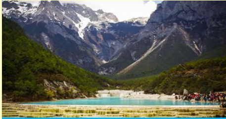
อุทยานไป๋สู่ยเหอ (หุบเขาพระจันทร์สีน้ำเงิน)

-รวมค่ากระเช้าขึ้น ลง ณ สถานีกระเช้า หยุนชานผิงที่สามารถเห็นภูเขาหิมะและทุ่งหญ้าสวิส (อยู่เหนือระดับน้ำทะเล 3,240 เมตร) จุดชมวิว หยุนชานผิง 云杉坪 เป็นทุ่งหญ้าขนาดใหญ่ ด้านทิศตะวันออกของยอดเขาหิมะมังกรหยก ณ จุดนี้นอกจากจะสามารถมองเห็นทัศนียภาพของภูเขาหิมะยังเป็นทุ่งหญ้าสีเขียวที่เสมือนพรมผืนมรกิตที่ปูอยู่บริเวณไหล่เขาของภูเขาหิมะมังกรหยก ได้รับการขนานนามว่าเป็นสวิสแห่งมณฑลยูนนาน