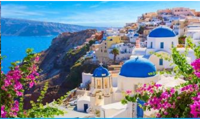
ย่านซานโตรินี่