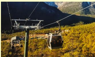
บึงกระเช้าสถานี หยุนชานผิง

หรือท่านสามารถเลือกซื้อโปรแกรมเสริม OPTIONAL TOUR แพคเกจท่องเที่ยวภูเขาหิมะมังกรหยกแบบครึ่งวัน อัตราค่าบริการท่านละ 3,500 บาท ในอัตราค่าบริการรวมรายการดังนี้