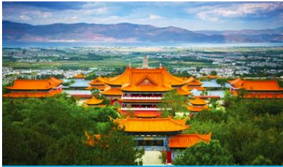
เมืองต้าหลี่