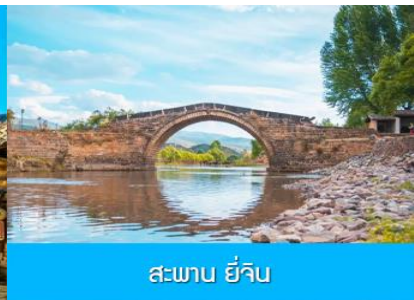
สะพาน ยี่จู๋