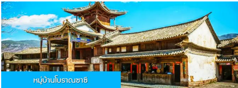
หมู่บ้านโบราณซาซี