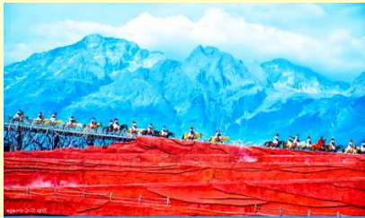
IMPRESSION OF LIJIANG