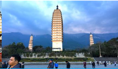
เจดีย์สามองค์