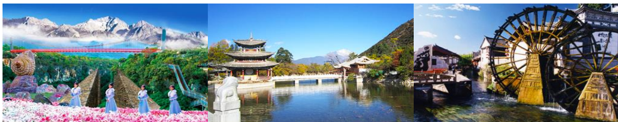
Snow Mountain Canyon Park

พักที่ LIJIANG FENGHUANG HOTEL โรงแรมระดับ 4 ดาวท้องถิ่น หรือเทียบเท่าในเมืองลี่เจียง