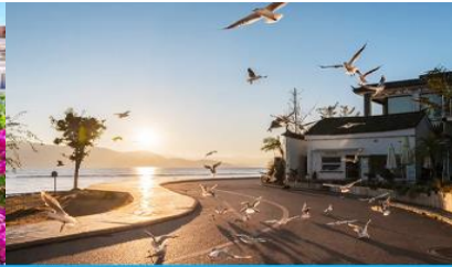
ย่านชายหาดรูป S