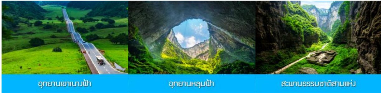
อุทยานเขานางฟ้า

พักที่ MOUNTAIN VIEW HTL // DAWEIYING HTL โรงแรมระดับ 4 ดาวหรือเทียบเท่าในเมืองอู่หลง