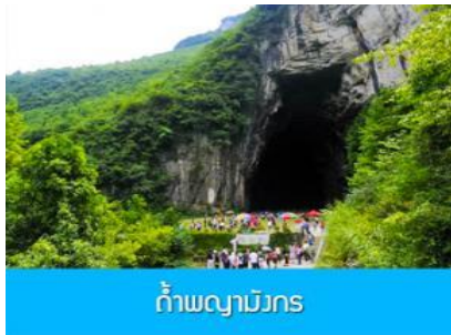
ถ้ำผญามังกร

พักที่ VIENNA HOTEL โรงแรมระดับ 4 ดาวหรือเทียบเท่าในเมืองเินซือ