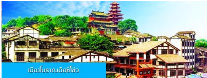
เมืองโบราณฉือชิว

OPTIONAL TOUR ใ้คนำเสนอโปรแกรมล่องเรือ ชมความสวยงามสองริมฝั่งแม่น้ำของมหานครฉงชิ่ง ท่านละ 280 หยวน หรือ 1,400 บาท