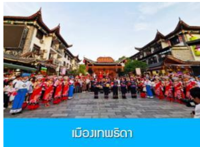
เมืองเทพริดา