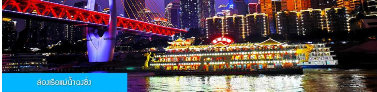
ล่องเรือแม่น้ำฉงชิ่ง

พักที่ HAITANGLIZHI HOTEL โรงแรมระดับ 4 ดาวหรือเทียบเท่าในเมืองฉงชิ่ง