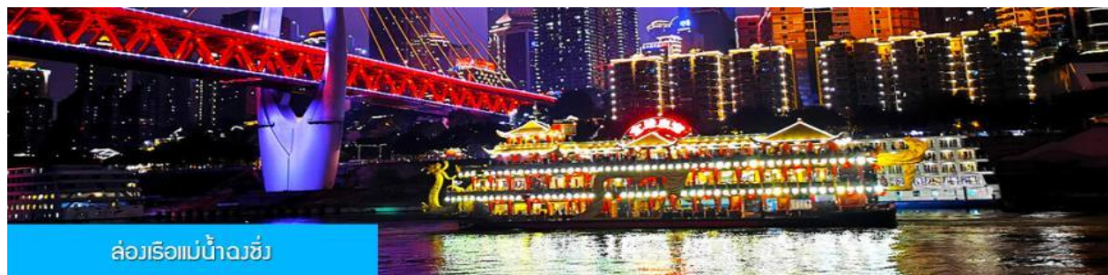
ล่องเรือแม่น้ำฉงชิ่ง

พักที่ HAITANGLIZHI HOTEL โรงแรมระดับ 4 ดาวหรือเทียบเท่าในเมืองฉงชิ่ง