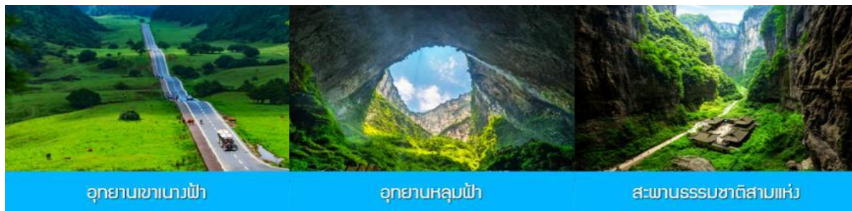
อุทยานเขานางฟ้า

พักที่ MOUNTAIN VIEW HTL // DAWEIYING HTL โรงแรมระดับ 4 ดาวหรือเทียบเท่าในเมืองอู่หลง