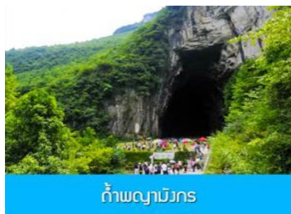
ถ้ำผญามังกร

พักที่ VIENNA HOTEL โรงแรมระดับ 4 ดาวหรือเทียบเท่าในเมืองเินซือ