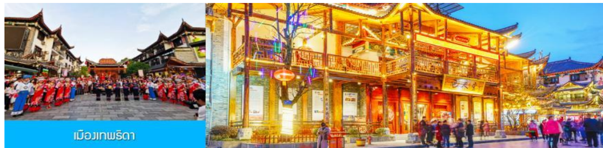
เมืองเทพริดา