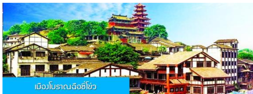
เมืองโบราณฉือชิว

OPTIONAL TOUR ใ้คนำเสนอโปรแกรมล่องเรือ ชมความสวยงามสองริมฝั่งแม่น้ำของมหานครฉงชิ่ง ท่านละ 280 หยวน หรือ 1,400 บาท