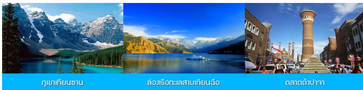
ภูเขาเทียนชาน

พักที่ HAMPTON BY HILTON URUMQI HOTEL โรงแรมระดับ 4 ดาวหรือเทียบเท่าในเมืองอูรูมูฉี