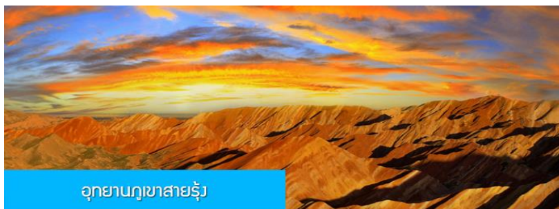
อุทยานภูเขาสายรุ้ง

หมายเหตุ ตัวโดยสารของขบวนรถไฟของแต่ละคณะอาจปรับเปลี่ยนตามขบวนรถที่จองได้จริง ทั้งนี้ขึ้นอยู่กับความซ้ำเร็วในการจองตั๋วของลูกทัวร์ในแต่ละคณะ และจำนวนที่ว่างของแต่ละขบวนรถไฟเป็นสำคัญ นำคณะเดินทางเข้าสู่ที่พักในเมืองจางเยี่ย เมืองจางเยี่ย (จางเยี่ย) 张掖 ตั้งอยู่ทางทิศตะวันตกเฉียงเหนือของมณฑลกานซู่ เป็นเมืองสำคัญที่เป็นทางผ่านของเส้นทางสายไหมโบราณ เป็นที่ตั้งของ อุทยานธรณีวิทยาต้นเสียดังเยี่ย 张掖丹霞地貌景区 ที่ได้รับการขึ้นทะเบียนเป็นมรดกโลกทางธรรมชาติจาก UNESCO และได้รับการขึ้นทะเบียนเป็นอุทยานท่องเที่ยวทางธรณีวิทยาของจีนด้วย..... ที่พักที่ โรงแรม QIANXI SILU HOTEL ระดับ 4 ดาวห้องถ้ำหรือเทียบเท่าในเมืองจางเยี่ย