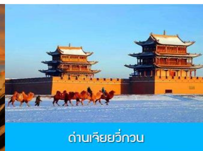
ด่านเจียวกวน