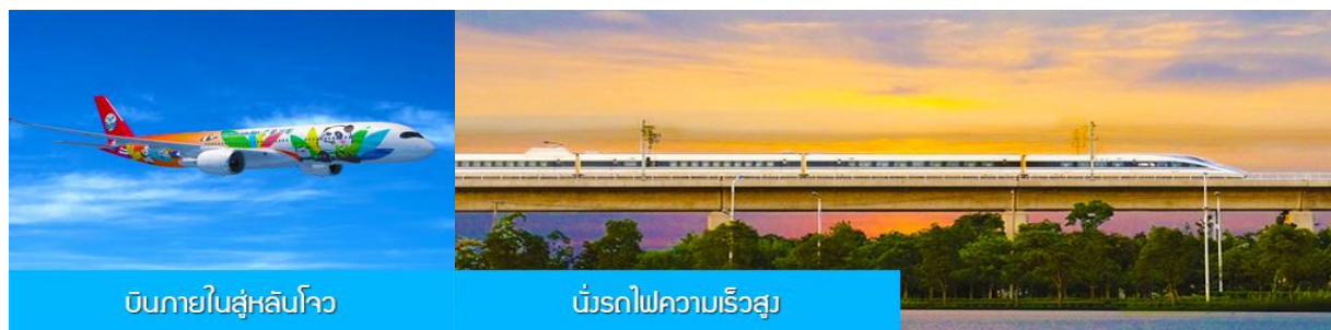
บินภายในสู่หลันโจว

พักที่ JOYHUB CHEER HOTEL โรงแรมระดับ 4 ดาวท้องถิ่น หรือเทียบเท่าใกล้สนามบินเฉิงตู