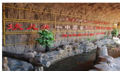
ระบบชลประทานคู่อู๋ฟาน