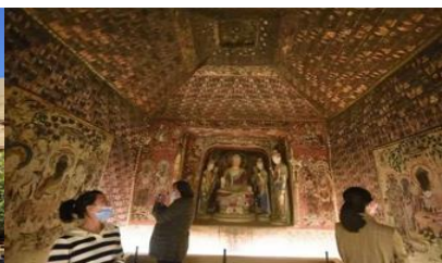
ชมภาพยอนตร์ 3 มิติ