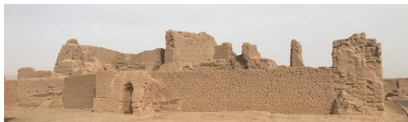
เมืองโบราณเกาซาง