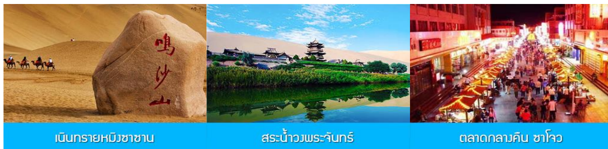
เนินทรายหมีขาซาบ

พักที่ REZEN HOTEL ระดับ 4 ดาวห้องดีนหรือเทียบเท่าในเมือง เจียยวี่กวน