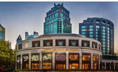
สตาร์บัคใหญ่ที่สุดในโลก