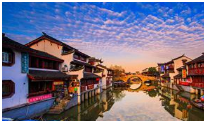
เมืองโบราณ ซูเป่า