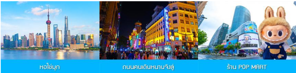
หอไข่มุก