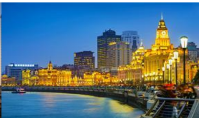
หาดวูกาน