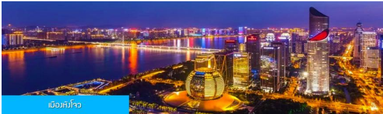
เมืองหังโจว