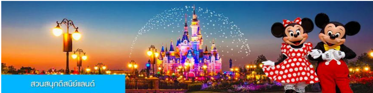
สวนสนุกดิสนีย์แลนด์

พักที่ รือ่งรแรม Heyi Hotel or Holiday Inn Express Hotel 4* หรือเทียบเทอำในเมือ่งเซียงฮៃ