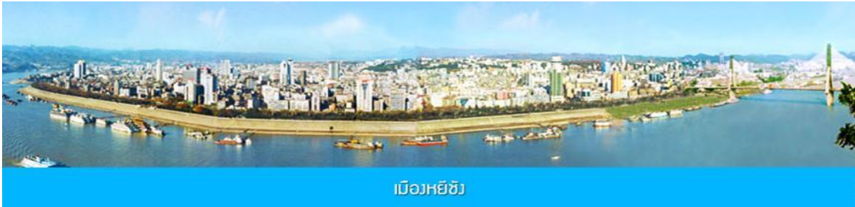
เมืองหยีชัง