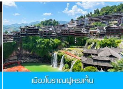
เมืองโบราณฝูหยางเจิน