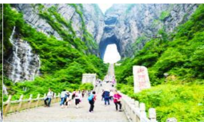
บันได 999 ขั้น