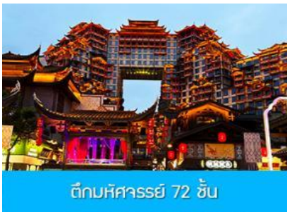
ตีกลับศวรรษ 72 ชั้น

พักที่ CHANGDE YUNXI HOTEL ระดับ 4 ดาวท้องถิ่น หรือเทียบเท่าในเมืองฉางเต๋อ