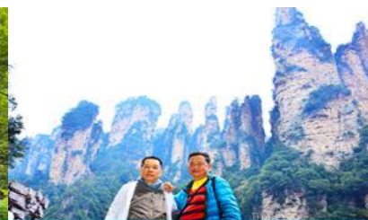
ชมจุดชมวิวลีฟกัแก้ว