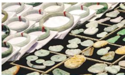
ศูนย์จำหน่ายผลิตภัณฑืหยก

อัตราค่าบริการสำหรับโปรแกรมเสริมการแสดงชุด The love Story of Wooden man and Fairy Fox ท่านละ 400 หยวน (หรือ 2,000 บาทขึ้นอยู่กับอัตราแลกเปลี่ยน) ระยะเวลาที่ใช้ในการเที่ยวชมการแสดง ประมาณ 3 ชั่วโมง รวมเวลาเดินทางไป กลับค่าบริการรวม ค่าบัตรเข้าชม ค่ารถรับ ส่ง และค่าน้ำดื่มของไกด์ท้องถิ่น พักที่ ZHENMIAN HOTEL โรงแรมระดับ 4 ดาวหรือเทียบเท่า