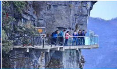
หน้าพลาวยฟ้าทางเดินกระจก