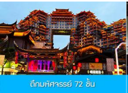
ตึกมหัศจรรย์ 72 ชั้น

พักที่ CHANGDE YUNXI HOTEL ระดับ 4 ดาวท้องถิ่น หรือเทียบเท่าในเมืองฉางเต๋อ