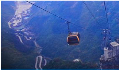
กระเช้าขึ้นเทียนเหมินซาน

https://hk.trip.com/hotels/guzhang-hotel-detail-68614854/chaxitai-holiday-hotel/