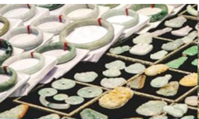
ศูนย์จำหน่ายผลิตภัณฑืหยก

อัตราค่าบริการสำหรับโปรแกรมเสริมการแสดงชุด The love Story of Wooden man and Fairy Fox ท่านละ 400 หยวน (หรือ 2,000 บาทขึ้นอยู่กับอัตราแลกเปลี่ยน) ระยะเวลาที่ใช้ในการเที่ยวชมการแสดง ประมาณ 3 ชั่วโมง รวมเวลาเดินทางไป กลับค่าบริการรวม ค่าบัตรเข้าชม ค่ารถรับ ส่ง และค่าน้ำทิพย์ของไกด์ท้องถิ่น พักที่ ZHENMIAN HOTEL โรงแรมระดับ 4 ดาวหรือเทียบเท่า