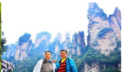
ชมจุดชมวิวลีฟกัแก้ว