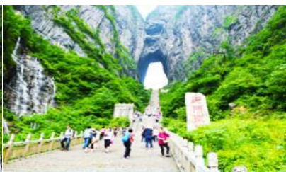
บันได 999 ขั้น