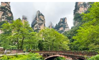
จุดชมวิวจิบเปียนซี