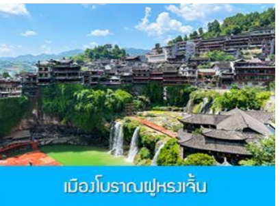
เมืองโบราณฝูหลวเจี้ยน