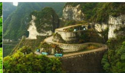
เส้นทาง 99 โค้ง