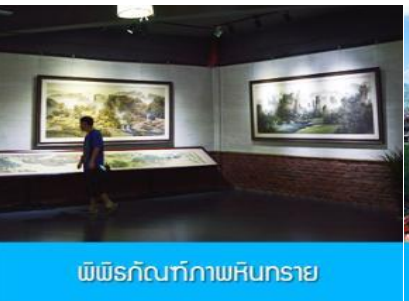
พิพิธภัณฑ์ภาพหินทราย