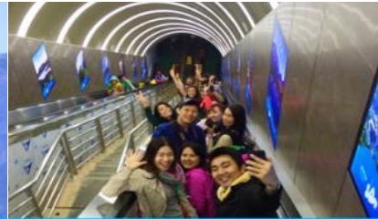
บันไดเลื่อนทะลุภูเขา

วันที่สี่ เมืองโบราณฝูหรงเจิน – ศูนย์ผลิตถัณฑ์ยางพารา – กระเช้าขึ้นเขาเทียนเหมินซาน – ระเบียบแก้ว เลียบหน้าผา – บันไดเลื่อนทะลุภูเขา – (เลือกซื้อโปรแกรม ออฟชั่น โชว์จิ้งจอกขาว)