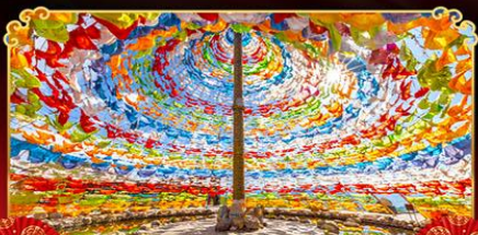
รงมนต์อริชชาน

พิธี "ภูเขาหิมะมังกรหยก" หนึ่งในสถานที่ท่องเที่ยวระดับ 5A