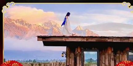
YUN TI YANG CAFE