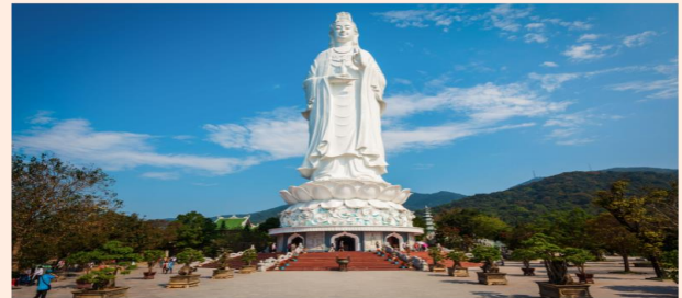
LINH UNG PAGODA